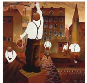
「イン・ザ・ガーデン」