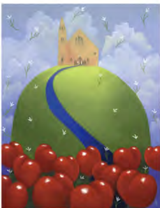
「タウン・プライド」