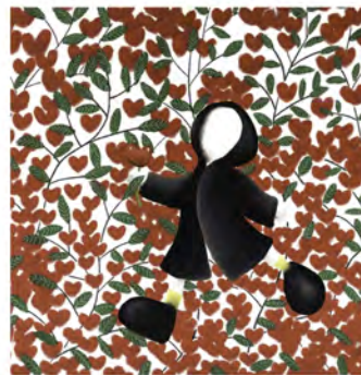
「ワールド・オブ・ラブ」