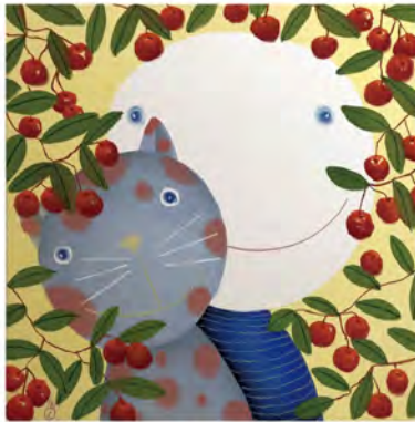
「いつも愛してるよ」 ※ NEWoMan 新宿のみ展示