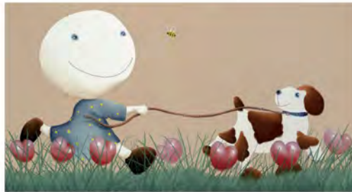
「ハチさん見つけた!」