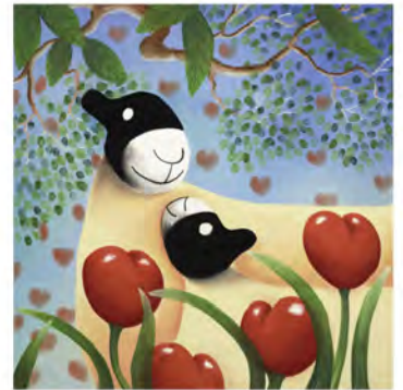
「I Love You Too」