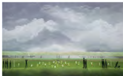
「トレーニング・デイ」